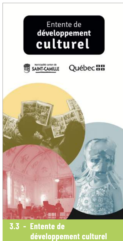
3.3 - Entente de développement culturel