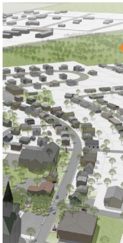
3.2 - Planification urbanistique

La Corpo a accompagné la Municipalité dans un dépôt de projet pour mettre à niveau le sentier familial de Saint-Camille. En plus du rechargement du sentier et du remplacement du mobilier, le projet prévoit une révision de la signalisation.