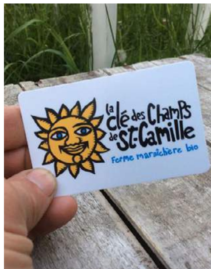
1.3 - Marché fermier de la Clé des Champs